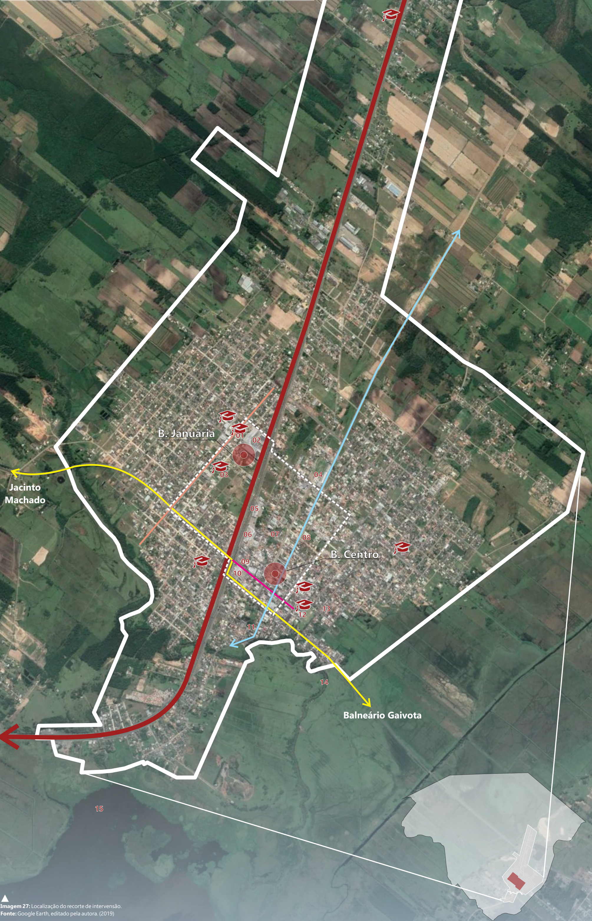
▲ Imagem 27: Localização do recorte de intervenção. Fonte: Google Earth, editado pela autora. (2019)